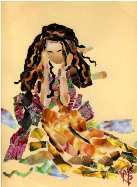
Рисунок 3. М. Романчук «Восточные мотивы» Например, аппликация «Девушка, идущая по воде» (Рис. 1) может при одном взгляде вызывать у зрителя ассоциации, связанные с картиной, созданной в XIX веке, и с сюжетом XIX века. При другом взгляде некоторые элементы картины со следами полиграфической продукции, напоминают о XXI веке. «Мерцает» время. «Мерцают» детская наивная свежесть (некоторые зрители при первом взгляде на картину говорили, что она создана ребенком) и, в то же время, зрелое понимание жизни художником (об этом напоминают и очертания фигурки девушки, и умелый подбор