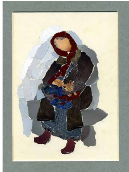
Рисунок 4. М. Романчук «Вдвоем» материала для изображения, воды, окружающей природы, одежды).

В картинах Марьяны Романчук восхищают плавные переходы цветов и оттенков, лепка формы объемных предметов на плоскости, что вызывает в памяти прекрасные образцы древнейшего искусства мозаики, на которых, если смотреть с определенного расстояния - оживают художественные образы, а при рассматривании с других расстояний, точек зрения, при другом освещении - картина превращается в россыпь драгоценных камней.