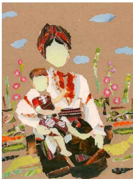
Рисунок 2. М. Романчук «Мать с ребенком»

Для работ Марьяны Романчук характерны лирические, «восточные», укра-