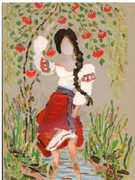
Рисунок 1. М. Романчук «Девушка, идущая по воде» также изображения, сложенные из «безымянных» фрагментов полиграфической продукции. В таких случаях можно говорить в какой-то мере о «публицистичности» этого произведения изобразительноно искусства.

В отличие от вышесказанного, большинство кусочков на аппликациях Марьяны Романчук «безымянные», то есть без признаков полиграфических изображений и текстов. Только отдельные элементы имеют на себе минимальные такие признаки, что напоминает зрителю о материале произведения, но не подчеркивает это.