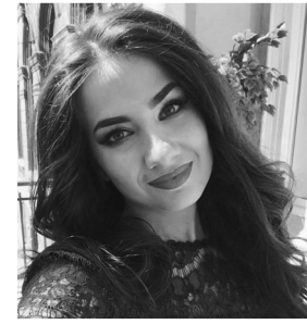
магістр, Одеський національний політехнічний університет