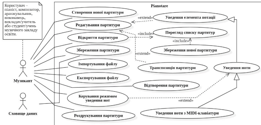
Рис. 1 – Діаграма варіантів використання мобільного застосування фіксації музичних партитур

На підставі проведеного аналізу програмних систем і наявних проблем можна зробити висновок щодо необхідності розроблення мобільного застосування фіксації музичних партитур для фортепіано з використанням спеціалізованих пристроїв. На рисунку 1 представлено діаграму варіантів використання такого застосування.