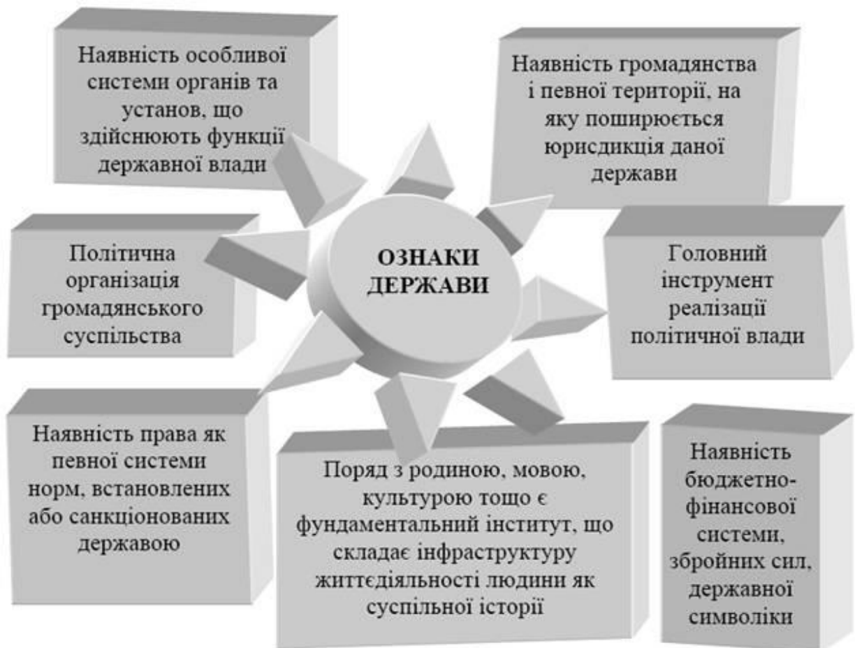
Рис.1.1. Ознаки держави.

Ознаки держави визначають внутрішні й зовнішні державні зв'язки як необхідну форму існування і розвитку сучасних суспільств (Рис.1.1.).