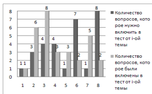
Рис. 2. Пример отклонения количества выбранных вопросов от необходимого количества вопросов для теста по предмету «Человеко-машинное взаимодействие»

По предмету «Моделирование и анализ ПО» был выбран приоритет по коэффициенту важности.