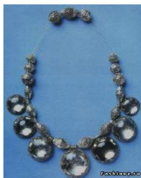
Рис. 3. Намисто з острова Готланд. Срібло, гірський кришталю. Приблизно 1000 в. Стокгольмський історичний музей

Втім, не менш ефектно в цьому сенсі виглядало б і намисто із срібла. Особливо, якщо б воно було схожим із намистом з острова Готланд (рис. 3). Блиск такої прикраси надали б намистини-лінзи із гірського кришталю.