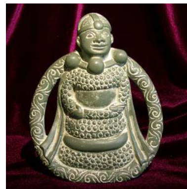
Рис. 1. Древні фігурки Фрейї

Зв'язок Фрейї із Сонцем стає ще більш очевидним, якщо згадати, що серед її атрибутів є не лише блискуче намисто, але й накидка із соколиного пір'я, вдягаючи яку вона перетворюється в птаху. У деяких народів (в Древньому Єгипті, на