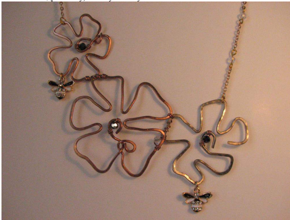
Рис. 7. Кольє «Фрейя». Автор – Лада Прокопович. Одеса, 2015 р.

Втім, спроби «відтворити» Брисінгамен не припиняються (рис. 7). І напевно чи припиняться. Бо питання про те, як могла виглядати ця прикраса, завжди буде хвилювати не лише дослідників, а й ювелірів.