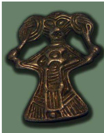
Рис. 5. Срібна фігурка Фрейї. Національний музей Данії

У фігурки, що представлена на рис. 4, нічого подібного немає. Але, якщо порівняти її з іншою фігуркою (рис. 5), обличчя якої схоже із котячою мордочкою, а зачіска складається із двох ефектних вузлів, то з'являються підстави вважати такі фігурки зображеннями саме Фрейї.