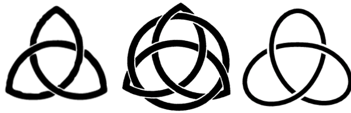
Рис. 6. Варіанти трикветру

Трикветр, як знак, використовувався ще в бронзову добу народами Північної Європи для фіксації положення Сонця на небосхилі: три кути знаку відповідають сходу, zenіту і заходу. Як символ, він пов'язувався із уявленнями про життя, смерть і повернення до життя як безкінечний цикл [12]. Трикветр із закругленими кутами – три замкнуті окружності – символізував ще й жіноче начало, родючість.