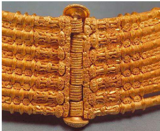
Рис. 2. Золоте намисто. V ст. Фрагмент. Стокгольмський історичний музей

В скандинавському ювелірному мистецтві особливе місце займають широкі, схожі на комір, намиста-гиринні. Одна з таких вражаючих прикрас зберігається у Стокгольмському історичному музеї. Це намисто складається з 458 найдрібніших золотих деталей, важить 823 г (рис. 2). Виготовлено воно в V столітті, знайдено — в XIX столітті у Вастергютланді. Виконано намисто настільки витончено й винахідливо, що сучасні ювеліри не можуть до кінця зрозуміти техніку його виконання.