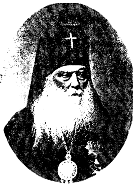
Рисунок 1 – Архієпископ Димитрій

В 1775-1785 рр. край входив в Славянсько-Херсонську єпархію, а з 1837 р. була створена Херсонсько-Таврійська єпархія з кафедрою в Одесі на чолі з архієпископом Херсонським і Таврійським, а з 1853 р. на Херсонщині існувало постійне вікаріанство і першим вікарним єпископом був у 1853-1858 рр. преосвященний архімандрит Полікарп з резиденцією в Успенському соборі. На його утримання казна виділяла 2,5 тис. крб. щорічно. Нарешті, у 1860 р. Херсонсько-Таврійську єпархію розділено на Херсонсько - Одеську (охоплювала Херсонську губернію) з кафедрою в Одесі і Таврійсько-Симферопольську (відповідно Таврійська губернія і Симферополь). Першим очолив Херсонсько-Одеську єпархію архієпископ Димитрій - до 1874р.