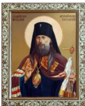
Рисунок – 7 архієпископ Прокопій Херсонський

Розстріляний 23 грудня 1937 р. Реабілітований по смертно. 5 вересня 1996 р. причислений до ліку святих мучеників православної церкви.