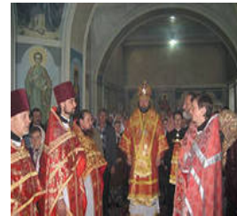
Рисунок 9 – Григоріє-Бізюківський монастир

Основна частина прихожан не розуміла богослужіння. Більшість селян дуже рідко відвідувало церкву бо з одного боку, поселення були на відстані 10-40 км від ближньої церкви, а з іншого, активізували свою діяльність протестанти і секти православ'я. Особливою релігійністю відзначалися купці і міщани. Церква відігравала, для більшості вірних не стільки релігійну, скільки громадську роль: ходили "не в церкву", а "до церкви". Серед монастирів краю найбільш відомий Григоріє-Бізюків.