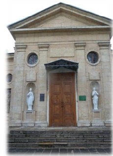
Рисинок 8 – Катеринський собор

У місті всі православні примусово приписувались до певного приходу і не можна було в іншій церкві, скажімо, хрестити дітей чи вінчатися.