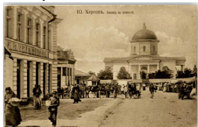
Рисунок 5 – Святодухівський Кафедральний Собор. Історичний вигляд

На початку ХХ століття Святодухівський храм був розширений і в такому вигляді він постає перед нами і нині. Ні в одному храмі Херсонської області, напевно, не знайдеться такого зібрання святих ікон, що представляють як художню, так і музейну цінність. З Києво-Печерської лаври у 1912 році місту Херсону подаровано ікону Божої матері зі святої гори Афон. Особливо шанується в соборі ікона "Скорботної Божої Матері". Художню цінність представляють такі ікони: ікона з мощами "Серафима Саровського", трьохстворчата ікона "Олександра Невського" в княжо-