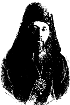
Рисинок 2 – Інокентій Архієпископ Херсонський.

Консисторія розпоряджалась пожертвуваннями прихожан, які використовувались на підтримку шкіл та училищ, благодійництво, ремонт храмів, на бібліотеки тощо. Вікарний єпископ відкривав (освячував) храми, керував духовенством, контролював виконання указів Синоду та духовний суд над прихожанами[1]. Існувало і духовне правління – колегіальний орган, члени якого призначались єпископом і який підлягав духовній консисторії. Воно виконувало рішення консисторії, в т.ч. про молебні на честь перемог Росії, про збір пожертвувань у 1812 р. під час Кримської війни, виявлення документів для написання історії Росії. Всього ж у Херсоні в 1818 р. було 10 церков, у 1857 р. - 12, в т. ч. 10 кам'яних і 2 дерев'яні.