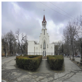
Рисунок 11 – Римо-католицька парафія Пресвятого Серця Ісуса Христа

У 20-х роках ХІХ століття тут побудована кам'яна церква і освячена в ім'я Святих Пія і Миколи.