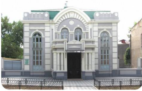
Рисунок 10 – Синагога Хабат

прикрашений виступом. По обидві сторони від дверей розташовані невеликі колони, а зверху - балкон з двома овальними вікнами.