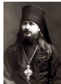
Рисунок – 6 архієпископ Прокопій Херсонський

1937 р. – знову арешт. Під час допиту заявив, що симпатизує монархії, але проти її насильницького відновлення і рахує, що «ідея необмеженої монархії в даний час віджила своє... Мене влаштовує такий лад, який би забезпечив Церкві повне відділення від держави і гарантував Церкві невтручання держави у її внутрішнє життя.»