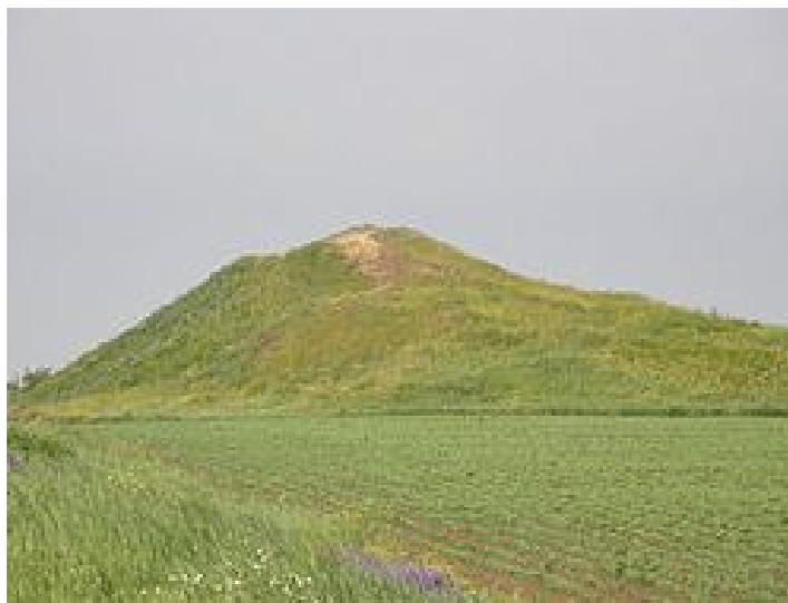
Рис. 2. Сучасний вигляд кургану Огуз

1 - Александропольський, 2 - Огуз, 3 - Чертомлик, 4 - Солоха, 5 - Велика Цимбалка, 6 - Козел, 7 - Верхній Рогачик, 8 - Миколаївський, 9 – Жовтокам’янка, 10 - П’ятибратне, 11 - Товста Могила, 12 - Червонокутський, 13 – Лемешев, 14 - Гайманова Могила, 15 - Мала Лепетиха, 16 - Башмачка, 17 - Страшна Могила, 18 - Бердянський, 19 – Мордвинський - I, 20 – Мордвинський -II, 21 -Мелітопольський, 22 - Куль-Оба, 23 - Мельгуновський.