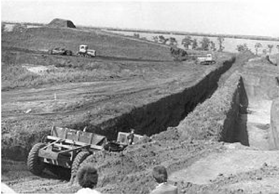
Рис. 3. Розкопки кургану експедицією під керівництвом Ю. В. Болтрика

Розкопки кургану, що продовжувалися в цілому дев'ять польових сезонів, що розтягнулися на дев'яносто років, були завершені.