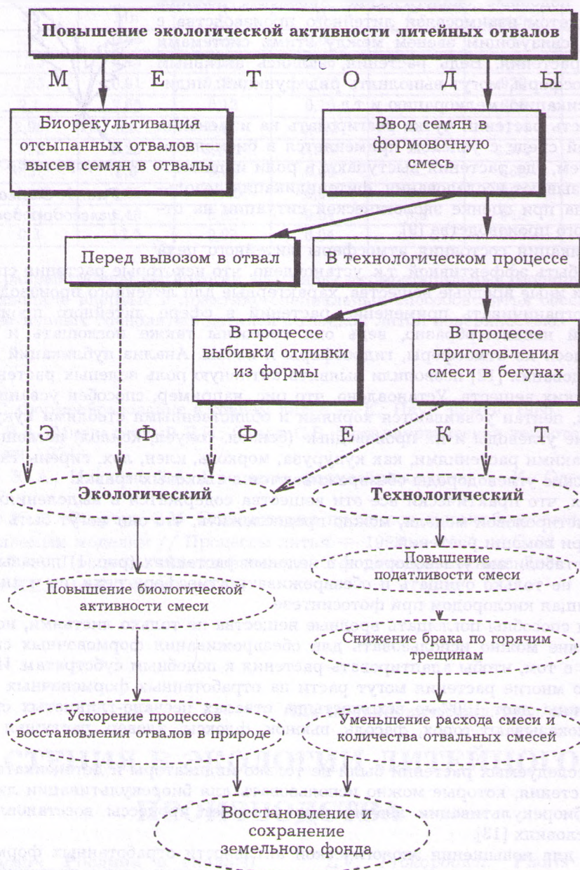
Рис. 2. Методы повышения экологической активности литейных отвалов

Это подтвердили производственные испытания, которые проводилась на одесском заводе “Центролит” при изготовлении опытной партии отливок, брак которых по “горячим” трещинам удалось снизить с 7,5 до 3,2 %, а в отвал ушла экологически активная формовочная смесь, содержащая около 0,5 % семян растений-мелиорантов и растений-детоксикаторов.