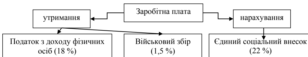
Рис. 2. Схема утримання та нарахування податків із заробітної плати у 2017 року