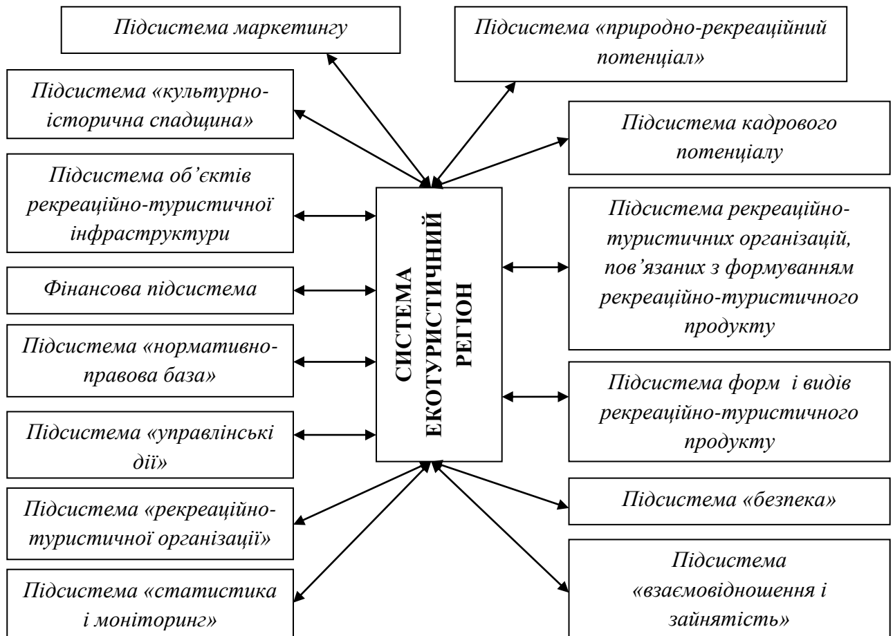
Рисунок 1 – Підсистеми єдиної комплексної системи екотуристичного регіону

Результати проведеного нами дослідження дозволили систематизувати основні принципи, на яких базуватиметься підприємницька концепція екотуризму в регіонах: ринкова орієнтація тур послуг та їх прибутковість; орієнтація на конкурентоспроможність; соціальна та екологічна спрямованість; самостійність в прийнятті господарських рішень; орієнтація на споживачів туристичних послуг.