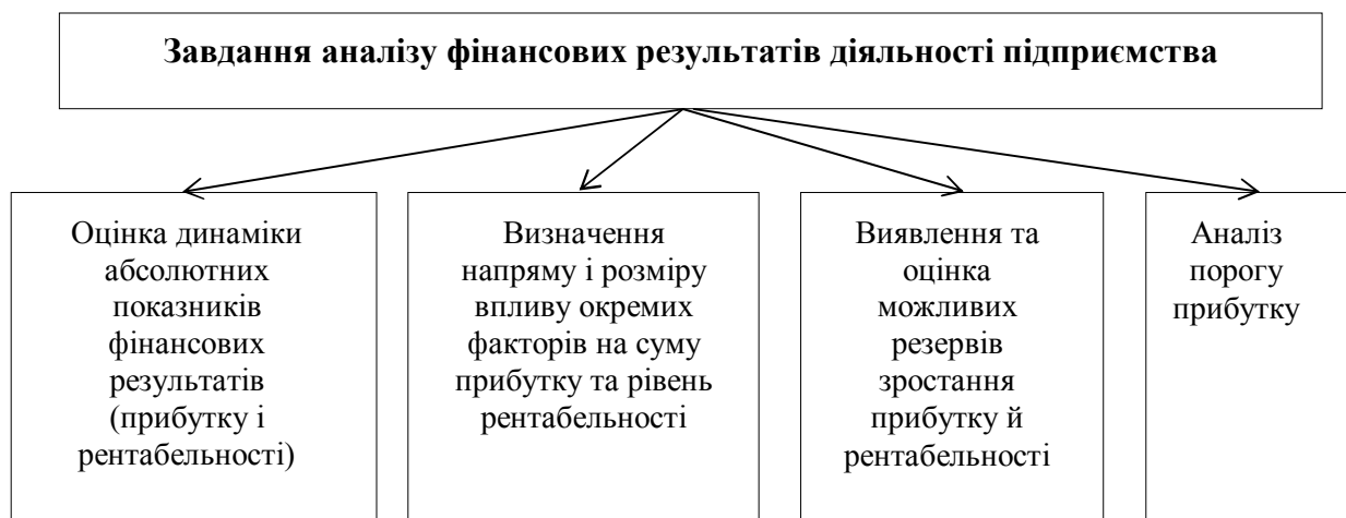
Рис. 1 – Завдання аналізу фінансових результатів

Головні завдання аналізу фінансових результатів діяльності підприємства (рис.1).