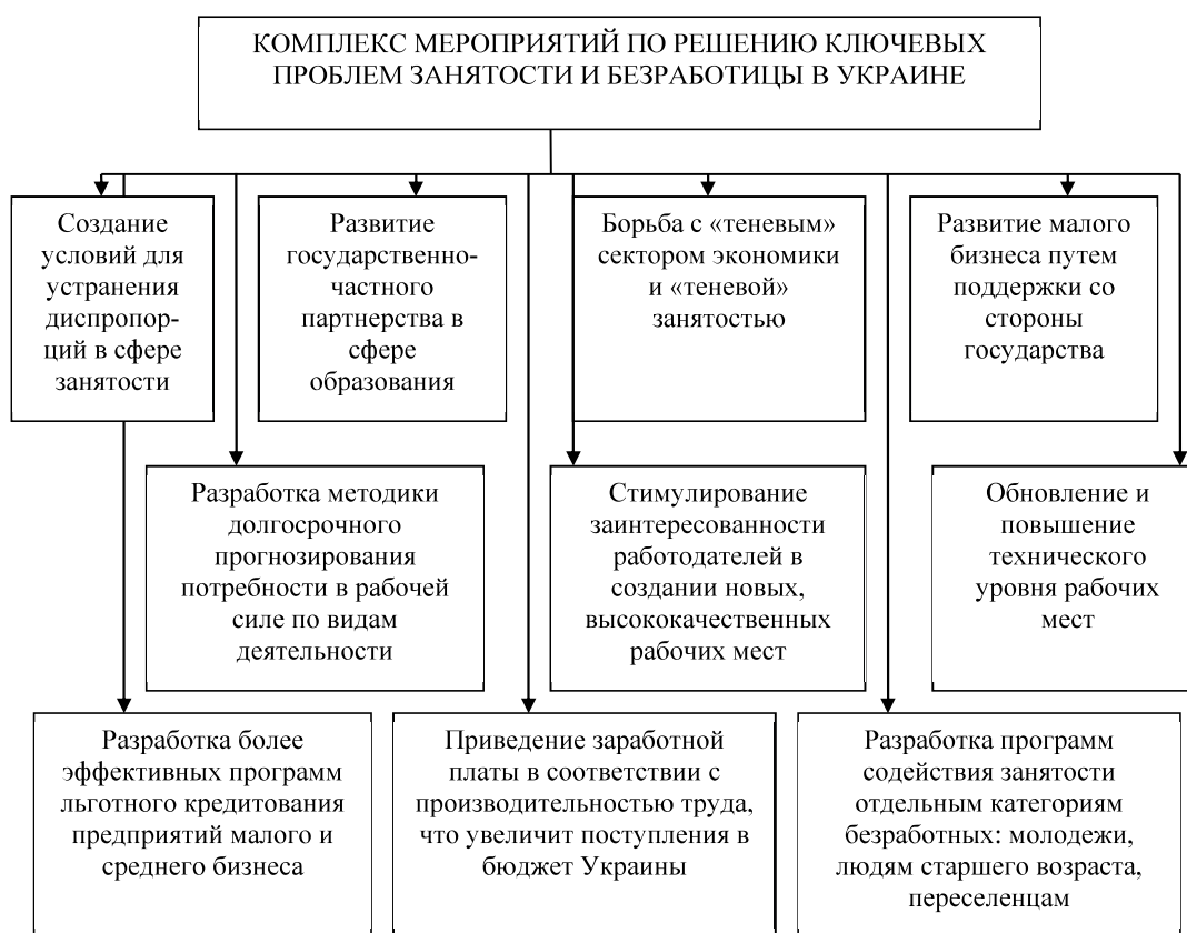
Рис. 3. Комплекс мероприятий по решению ключевых проблем занятости и безработицы в Украине

3. Борьба с «теневым» сектором экономики. В Украине в «тени» находится около 46% экономики, а соответственно, и рабочих мест [1]. Необходимы меры по регулированию налоговой системы и уменьшению нагрузки на фонд оплаты труда. Совершенствование налоговой