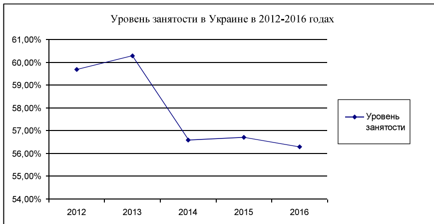
Рис. 1. Уровень занятости населения Украины за 2012–2016 гг.

Также в Украине обостряется ситуация с молодежной занятостью (удельный вес молодежи в общем числе безработных составил около 30%). Молодежь составляет отдельную часть рынка труда и развивается особым образом. С одной стороны, возраст способствует