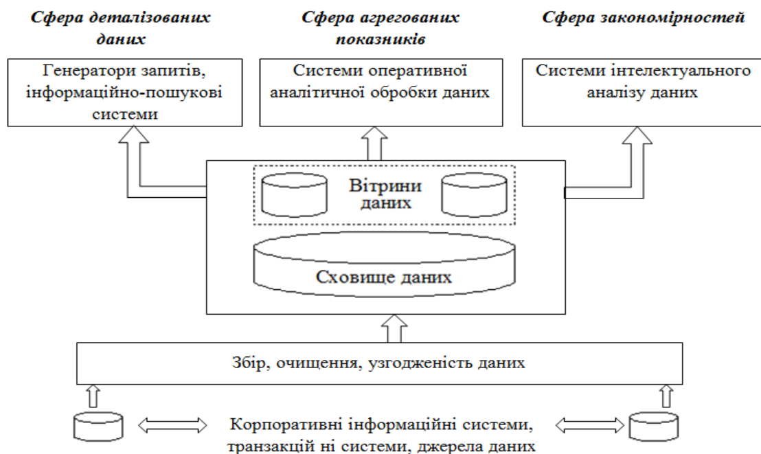
Рис.1. Загальна архітектура інформаційно-аналітичної системи [5, с.2]

Базовий статистичний аналіз та прогноз у модулі «Бізнес-аналітика» може містити: повний набір графічних інструментів, описові і внутрішньо групові статистики, розвідувальний аналіз даних; кореляції, t-критерії, таблиці частот, аналіз багатовимірних відгуків; множинну, регресію; підгонку розподілів; складання аналітичних звітів та ін. Загальна архітектура інформаційно-аналітичної системи представлена на рис. 1.