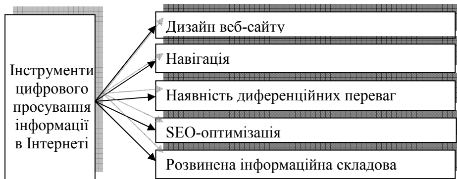
Рисунок 1.1 — Інструменти цифрового просування інформації в Інтернеті

Виділення цільової аудиторії дозволяє точніше направити інформаційний вплив і, як наслідок, веде до розвитку веб-сайту. Розрізняють такі групи цільової аудиторії веб-сайту: