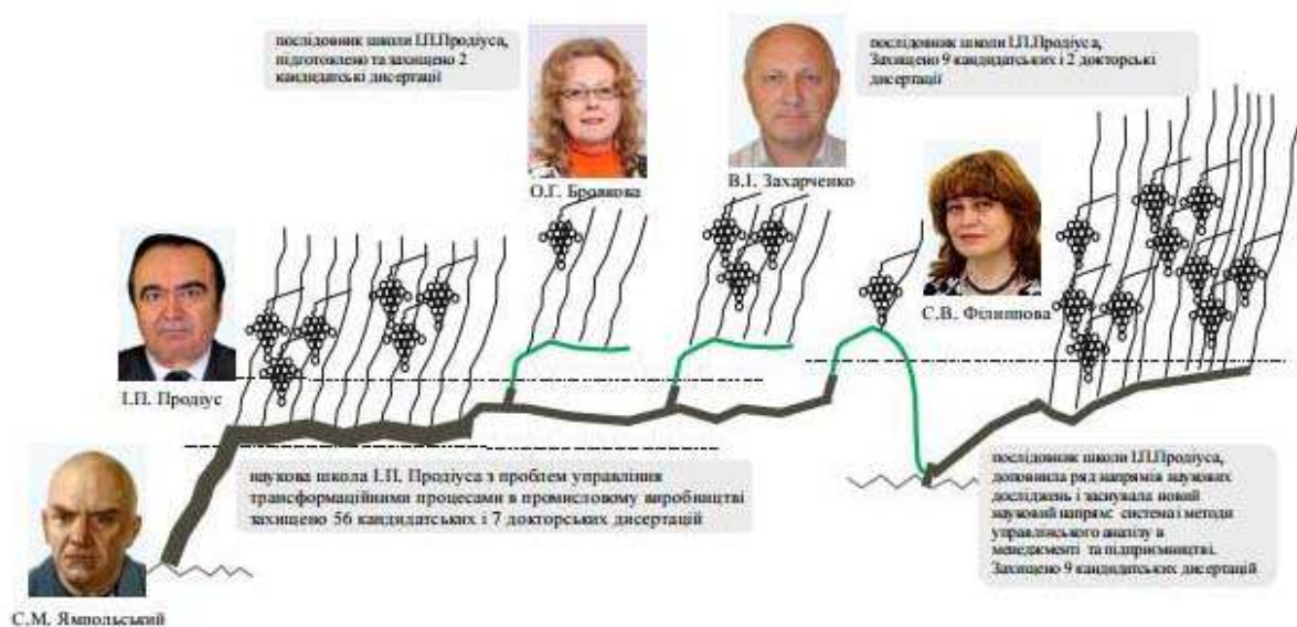
Рис. 1. Дерево наукової школи І.П. Продіуса «Проблеми управління трансформаційними процесами в промисловому виробництві»

працевдатність І.П. Продіуса дозволили йому створити власну наукову школу. Важливу роль І.П. Продіус приділяв вихованню наукових кадрів, тривалий час він був членом спеціалізованої вченої ради із захисту кандидатських та докторських дисертацій з економіки в Інституті проблем ринку та економіко-екологічних досліджень НАН України, членом Експертної Ради ВАК України. За роки плідної творчої праці професор І.П. Продіус підготував чимало талановитих учених та керівників різного рівня. Під керівництвом Івана Прокоповича захищено 56 кандидатських і 7 докторських дисертацій. Учні розвивали і поглиблювали погляди наукового керівника щодо розвитку економічних процесів на різних рівнях управління. Найбільш плідно продовжують наукову школу І.П. Продіуса його учні, які пов'язали свою трудову діяльність з Одеським національним політехнічним університетом (рис. 1).