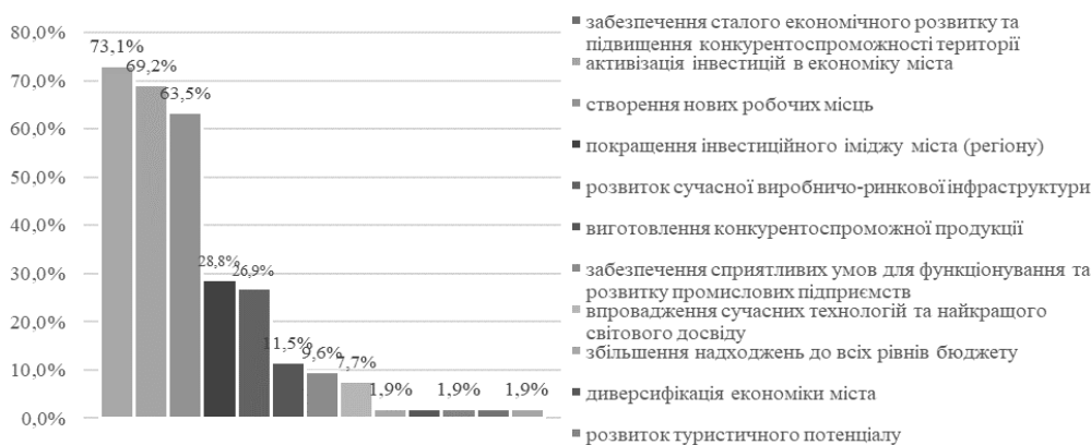
Рис. 3. Основні цілі створення індустриальних парків України [побудовано авторами за даними Мінекономіки України [1]]