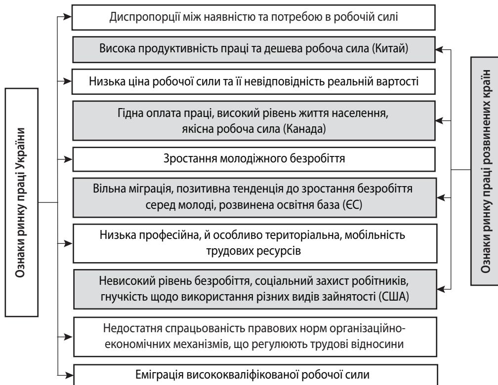
Рис. 1. Порівняльний аналіз розвинених країн за основними ознаками ринку праці