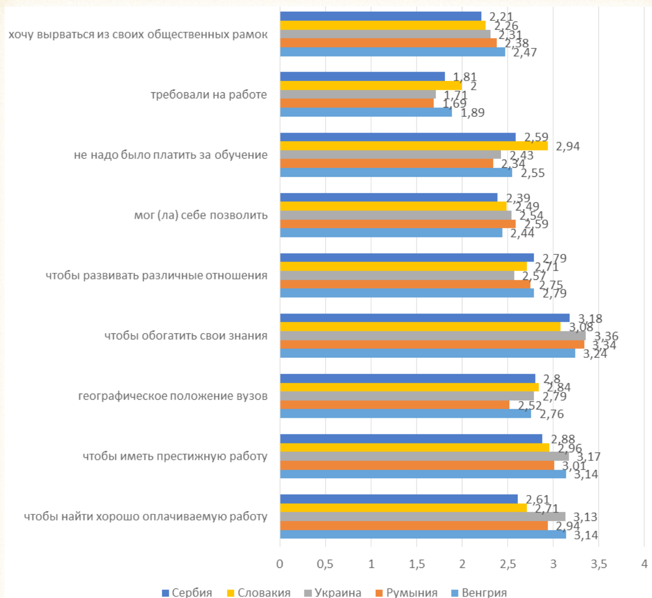
Рисунок 2 Мотивация к дальнейшему образованию по странам (средние баллы по шкале 1–4, p \leq 0,05 ).

В современных условиях молодежь вынуждена адаптироваться, реализуя трудовую мобильность. Исходя из результатов исследования, можно утверждать, что молодежь обладает высокой готовностью к труду при условии выгодной оплаты, готовы много работать для обеспечения собственного материального благополучия, независимо от того будет ли совпадать характер будущей сферы занятости с полученной специальностью. Кроме того, молодежь обладает гибкостью относительно изменения профессиональной деятельности, чему способствует появление различных нетрадиционных, нестандартных форм занятости на рынке труда (временная, нестандартная занятость), и это дает возможность совмещать работу и учебу.