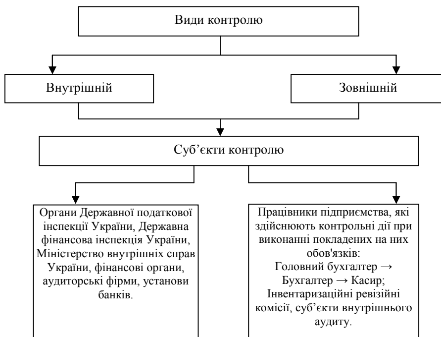
Рис. 3. Види контролю готівкових грошових коштів

Контроль готівкових грошових коштів у морських торговельних портах повинен підлягати внутрішньому і зовнішньому контролю в залежності від суб'єктів, які його здійснюють (рис. 3).