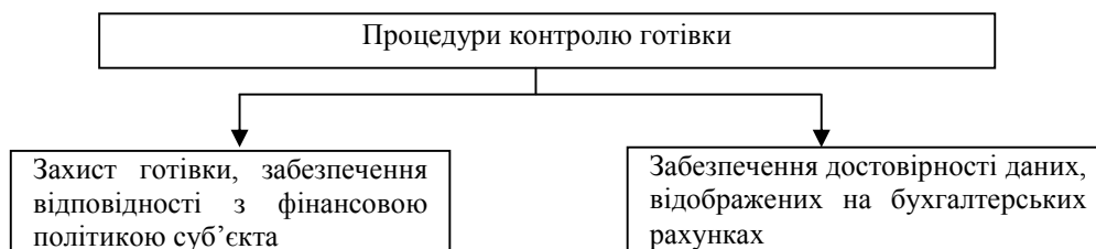
Рис. 1. Процедури системи контролю готівкових грошових коштів

Готівка являється абсолютно ліквідним активом і тому більше усього сприйнятлива до розкрадань. Тому на підприємстві необхідно запровадити постійний контроль за схоронністю і рухом готівкових грошових коштів. Система контролю готівки у морських торговельних портах являє собою процедури, представлені на рис. 1.