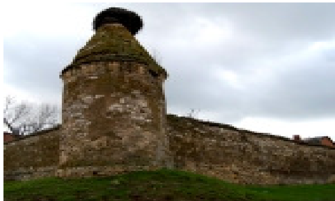
Рис. 4. Северо-восточная башня

Выводы. История возникновения и становления единоверчества - течения в старообрядчестве, тесно связана с учреждением Корсунского монастыря и его деятельностью в конце XVIII -первой половине XIX вв. В его судьбе отразилась самая мощная и многочисленная, единственная из неправительственных христианских церквей, поддерживаемых государством в течение 120 лет. Наиболее важными моментами были: документальное оформление в 1785г., учреждение в 1787-1797гг., и его функционирование первые 35-40 лет. Исключительную важность имеет переход Корсунского монастыря из единоверческого в православный в 1848г. Стены монастыря пережили войны, коллективизацию, гонения церкви. Корсунский монастырь выжил из руин, постепенно восстанавливается и играет важную роль в духовной жизни Херсонщины.