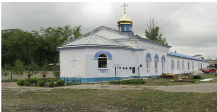
Рис. 1. Михайловская церковь