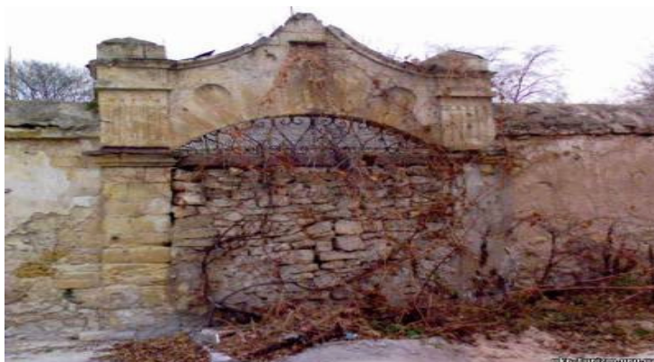
Рис. 3. Западные ворота монастыря

Также возле монастыря протекает маленькая симпатичная речушка Каменка - приток Днепра. В сухое время года она довольно узкая, а весной, в паводок, может разливаться настолько, что сухой остается только дорога с мостиком, которая пересекает речку. Если у Вас есть время - можно прогуляться по этой дороге, ведущей через мостик вниз - к Днепру и озерам [2].