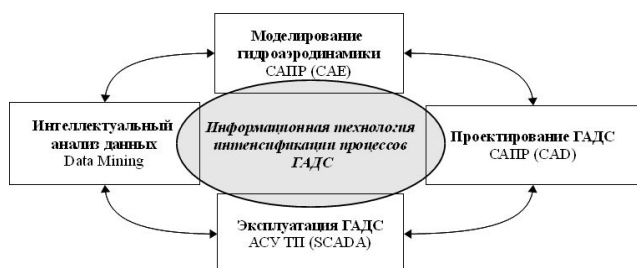
Рис. 1. Схема объединения форм представления данных в разных предметных областях

область на разных стадиях жизненного цикла ГАДС.