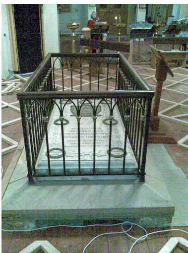
Рис.4. Надгробна плита князя Потьомкіну-Таврійському в соборі Катерини

На жаль, лише декілька пам'яток збереглося до нашого часу: частина фортечних валів, Очаківські та Московські ворота, Єкатерининський собор, пороховий погріб, фортечний колодязь та ряд інших будівель. Все це є визначними історичними пам'ятками, чудовими туристичними об'єктами, проте, всі вони потребують догляду та уваги .