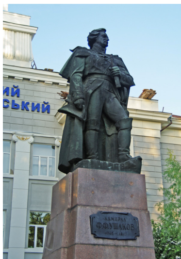
Рис.2 Пам'ятник князю Г.Потьомкіну-Таврійському

Вже через чотири роки на місці укріплення Олександр-Шанц починається грандіозне будівництво. Головним будівничим міста стає генерал-поручик Абрам Ганнібал. Плани дійсно вражають, в найскоріші строки необхідно збудувати порт, верф та фортецю, що зможе надійно захистити південні рубежі імперії. Також величезний внесок в формування нашогo міста та його становлення зробили князь Потьомкін, майбутній генералісимус Суворов та визначний адмірал – Федір Ушаков.