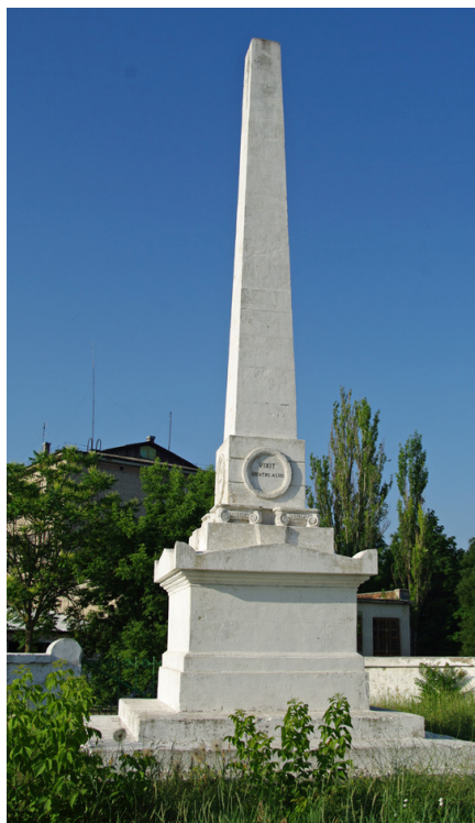
Рис.5. Пам'ятник Джону Говарду

Висновки. Ми пишаємося нашим містом і вважаємо, що його розвиток як значного туристичного центру Півдня України не тільки можливий, але й необхідний для виховання сучасної української молоді.