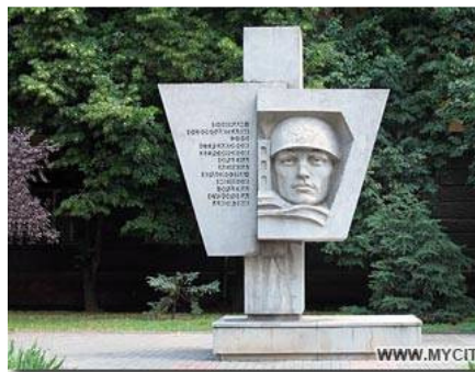
Рис. 9 Пам'ятник на честь героїв-визволителів 295-ї стрілецької дивізії

Вулиця тягнеться від Перекопської вулиці до перехрестя з вулицею ім. І. Куліка. Названа на честь армії, яка у березень 1944 року брала участь у проведенні Березнегувато-Снігурівської операції. Визволили Херсон, Миколаїв, інші населені пункти.