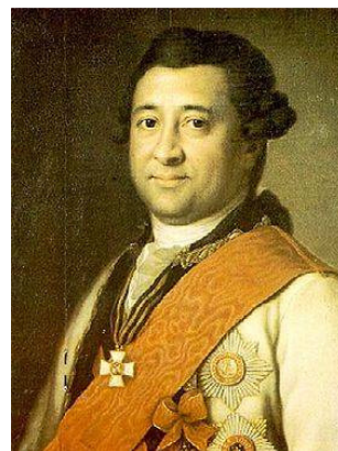
Рис. 1 Портрет Івана Ганнібала роботи невідомого художника

Вулиця показана на першому проекті міста Херсона 1779 року. На плані 1855 року — названа Потьомкінською на честь засновника Херсона, генерал-фельдмаршала, князя Григорія Олександровича Потьомкіна-Таврійського, який з 1774 по 1791 роки був генерал-губернатором Новоросійського краю. Потьомкінська вулиця була розділена Потьомкінським бульваром та Канатною площею на три частини. Від Дніпра до пам'ятника Потьомкіну (рис. 3) була найбагатша частина вулиці, натомість як найбідніша починалася за Канатною площею на Північному форштаті. У 1922 році вулиця Потьомкінська була перейменована у вулицю Карла Маркса.