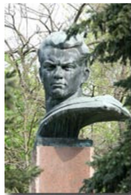
Рис. 12 Субота М.М.

Шенгелія Георгій Давидович, 1908 р.н., с. Кулаші, Грузія. Майор, командир батальйону 1038-го стрілецького полку 295-й Херсонської стрілецької дивізії 28-ї армії 3-го Українського фронту. Брав участь в оборонних боях на Україні, Північному Кавказі, у форсуванні Дніпра і визволенні міст Херсон, Миколаїв, Одеса, Яссько-Кишинівській та Вісло-Одерській операціях, форсуванні Одеру, штурмі Берліна. Помер 22 грудня 1981 року. Похований у Тбілісі.