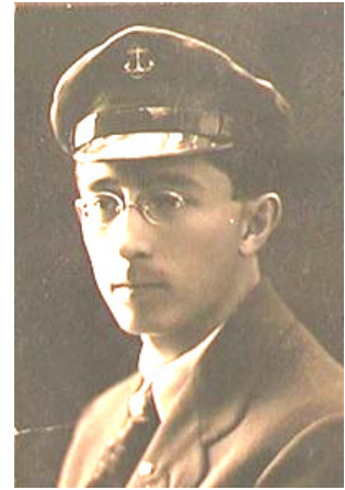
Рис. 4 Лавреньов Б.А.

Вулиця Лавреньова знаходиться у Шуменському мікрорайоні. вулиця названа на честь радянського письменника Лавреньова Б.А.(рис.4). Народився Борис Андрійович Лавреньов 17 червня 1891 р. в Херсоні в родині вчителя. Помер 7 січня 1959 р. в Москві. Закінчив юридичний факультет Московського державного університету ім. М. Ломоносова. Служив у лавах Червоної Армії. З 1921 р. — професійний літератор. Автор творів «Сорок перший», «Заколот», «Лермонтов» та ін. За його повістю «Вітер» кінорежисер М. Ільїнський створив фільм «Лють» (1965), а за однойменним оповіданням — кінокартину «Зоряний цвіт» (1971). За мотивами творів Б. Лавреньова «Гала-Петер» і «Марина» кінорежисер Б. Івченко зняв стрічку «Марина» (1974).