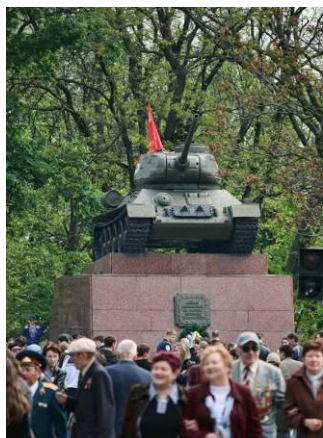
Рис.8 Парк Слави

Існує велика кількість вулиць міста, які нагадують нам про героїв, які захищали Херсон під час війни. Серед них вулиці 28-ї армії, 49-ї Гвардійської Херсонської дивізії, 295-ої стрілецької дивізії, І. Куліка, Комкова, Покришена, Суботи, Шенгелія, Качалова і т.д.