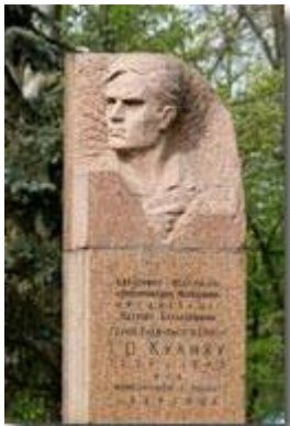
Рис. 10 Пам'ятник І. Кулику

Вулиця Ілюші Кулика (колишня назва: Козацька) — вулиця, розташована в Суворовському та Дніпровському районах Херсона. З'єднує проспект Ушакова з вулицею Залаегерсег.