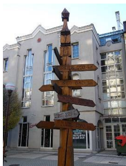
Рис.13 центр міста Залаегерсег

Вулиці, названі на честь міст-побратимів. Місто Херсон є членом Міжнародної Ассамблеї столиць і великих міст (суспільне некомерційне об'єднання, створене 2 вересня 1998 року для організації спільних дій з метою соціально-економічного розвитку міст.)