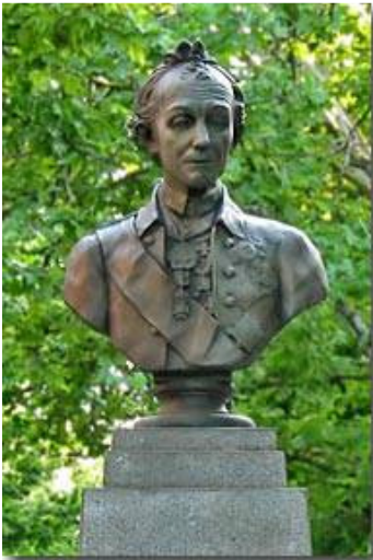
Рис. 5 Пам'ятник О.В. Суворову

Вулиця Суворова — вулиця в Херсоні, розташована в Суворовському та Комсомольському районах, з'єднує проспект Ушакова з вулицею Горького. Заснована в кінці XVIII століття. У 30-х роках XIX століття східну частину вулиці названо Богородицькою, а північно-західну — Католицькою (тут знаходився католицький храм). У 1855 р. вулиця вже мала назву Суворовська. У 1927 р. Суворовську вулицю було перейменовано у вулицю 1-го Травня, а у травні 1941 вулиця отримала сучасну назву. Зараз вулиця починається з пам'ятника О.В. Суворову (рис.5).