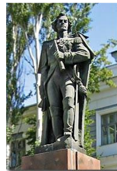
Рис.6 Пам'ятник Ф.Ф. Ушакову

Проспект Ушакова — центральний проспект Херсона, розташований у Суворовському районі. З'єднує берег Дніпра із залізничним вокзалом. Стара його назва — вулиця Поштова. У XVIII столітті західна її частина нараховувала декілька кварталів — на той час вона була крайньою східною вулицею Грецького передмістя. На плані початку 50-х років XIX ст. мала назву Пестелевської, на честь херсонського губернатора Пестеля В. І., який обіймав цю посаду з 1839 по 1845 роки. За часи Пестеля було здійснено проект благоустрою набережної Дніпра, що і стало приводом для увічнення його ім'я на мапі міста — у назві вулиці, що саме і йшла від набережної. На плані 1855 року вулиця названа Поштовою, тоді як найменування "Пестелевський" перейшло до бульвару, який було засаджено при Пестелі В.І. на початку 1840-х років. У 1890 році Поштову вулицю перейменовано у Говардівську — на честь англійського лікаря, філантропа Джона Говарда, який помер від висипного тифу у Херсоні в 1790 році. З 1947 року — проспект носить ім'я російського флотоводця Федора Федоровича Ушакова (1745- 1817) — російського флотоводця, адмірала, святого Російської Православної Церкви. Відзначився у історії міста тим, що наглядав за побудовою кораблів в Херсоні. На проспекті встановлено пам'ятник на його честь(рис. 6).