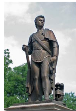
Рис. 3 Пам'ятник Г.О. Потьомкіну

ством, ливарним будинком, арсеналом, верфями, казармами і приватними будинками (рис. 2). Фортеця була забезпечена гарнізоном та 220 зброями, на верфі будувалися різні судна, в гавані знаходилися військові та купецькі кораблі, у місті заснували торговельні іноземні будинки. Ганнібал повернувся до Херсона та навколишніх земель багато грецьких та італійських вихідців.