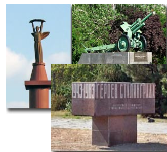
Рис. 7 Пам'ятники на лоцках міста, присвячені подіям Другої світової війни

Парк Слави (рис. 8) знаходиться у центрі міста і фактично є меморіальним комплексом, збудованим на честь героїв, які захищали місто.