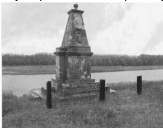
Рис. 2. Пам'ятник генерал-майорові І. М. Синельникову в с. Садове Білозерського району. Початок XX в.

губернського архітектора Казимира Квинто, що в 1902 році реставрував надгробний пам'ятник Синельникову в Катериинському соборі, на кошти Софії Миколаївни [2].