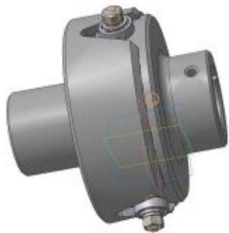
Рис. 1 Загальний вигляд муфти

Використання даних муфт дозволяє підвищити точність виготовлення деталей із матеріалів з нестабільною твердістю.