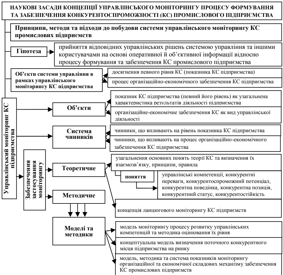
Рис. 1. Наукові засади моніторингу процесу формування та забезпечення конкурентоспроможності промислового підприємства

процесу загального управління підприємством, та б) інструментами впливу – чинниками зовнішнього та внутрішнього середовища (рис. 1).