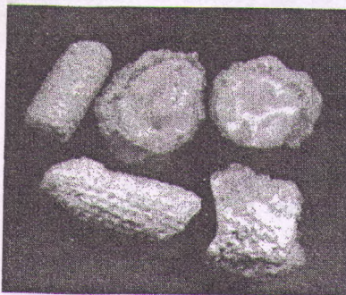
Рис. 2. Образцы древесных окаменелостей с сохранившимся строением коры и ярко выраженной кристаллической структурой сердцевины (из личной коллекции автора)

Примером тому могут служить древесные окаменелости. Процесс минерализации древесины сложен, и для него необходимы не только определенные условия, но и время (иногда миллионы лет). За эти многие годы минеральные вещества могут полностью заменить всю органическую часть древесины. При этом может сохраниться вся анатомия дерева, по которой можно определить его род и вид, а по сохранившимся годичным кольцам — возраст и нахождение относительно севера и юга.