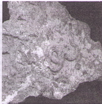
Рис. 3. Образец окаменевшего представителя фауны (из личной коллекции автора)

Учитывая, что Украина еще богата залежами каменного угля, кварцевых песков, известняков и других древних минеральных отложений, можно полагать, что в этом направлении есть большие перспективы для научных исследований.