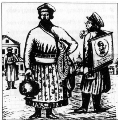
Рис. 1. Сбитенщик и торговец лубками. XIX в.

ния были неотъемлемой частью русской ярмарки. Вот, например, как балаганный зазывала уговаривал посмотреть спектакль “Петрушка” [7]: