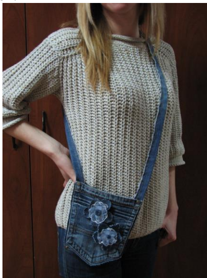
Рис. 3. Джинсовая сумочка. Автор – Лада Прокопович. Одесса, 2016

Ещё одним примером функциональной универсальности костюмных украшений могут служить декоративные сумочки (рис. 3), которые выполняют и утилитарную функцию, в качестве накладного (навесного?) кармана или несессера, и чисто эстетическую – в качестве украшения, дополняющего (или задающего) образ.