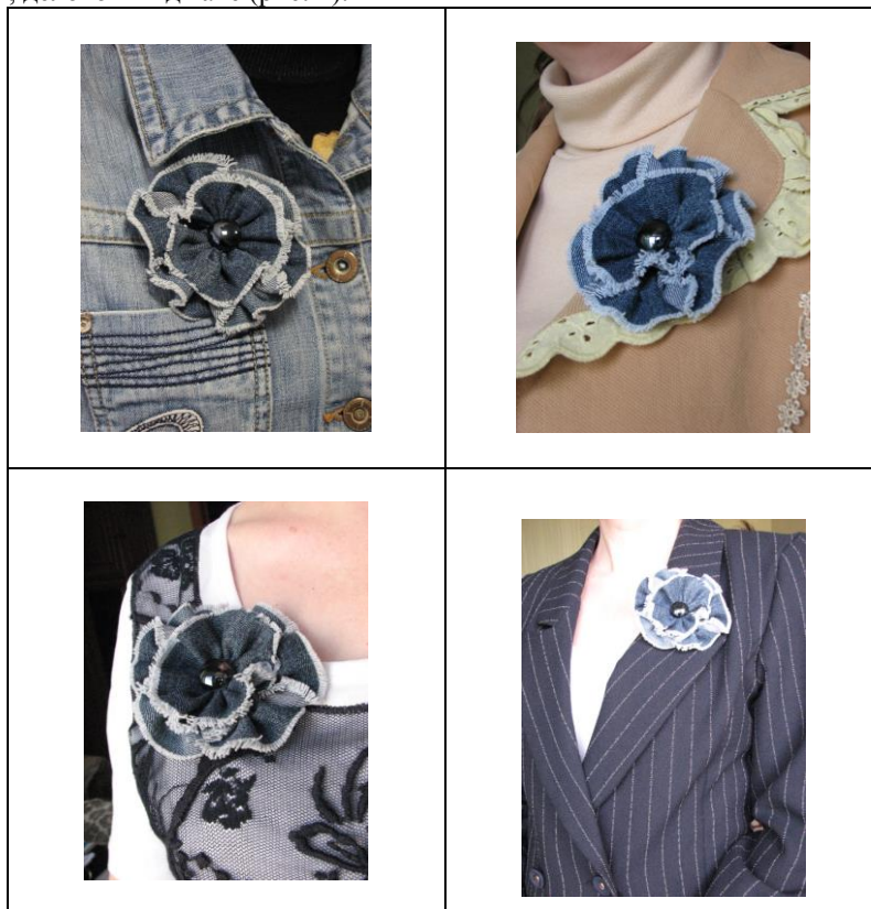
Рис. 1. Брошь «Джинсовая роза» (автор – Лада Прокопович, Одесса, 2015) как деталь различных костюмов

гипюром, и на жакете с романтической прошвой, и даже на строгом, деловом пиджаке (рис. 1).