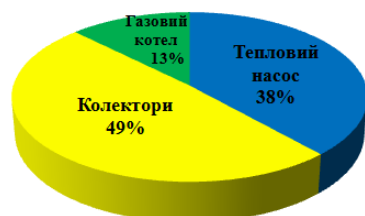
Рис. 3. Доля замещения тепла источниками тепла в комбинированной тепловой схеме для учебного корпуса

По результатам исследования были получены доли замещения потребляемой тепловой энергии различными источниками тепла (рис. 3).