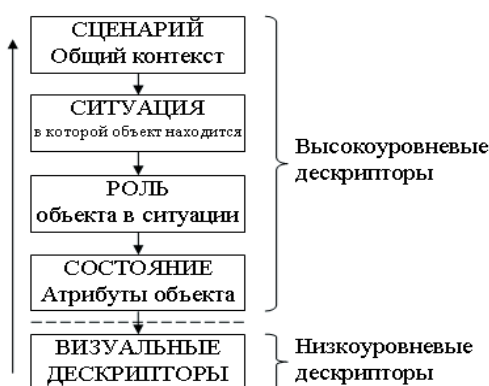
Рис. 1. Онтология предметной области

Онтологии содержат реляционную структуру концептов, которые могут быть использованы для описания и рассуждения об аспектах мира. Содержимое сцены организуется в виде иерархической онтологии (рис. 1), путем его декомпозиции на несколько уровней абстракции: общие сценарии, ситуации, в которых оказываются объекты, выполняемые ими роли и их состояния (атрибуты).