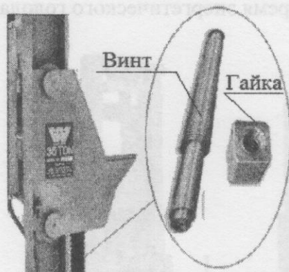
Рисунок 2 – Винтовая кинематическая пара трения скольжения.

Проанализировав кинематическую схему, приходим к выводу, что потери электроэнергии будут в следующих местах: в верхнем подшипнике; в винтовой кинематической паре; в зонах контакта роликов каретки с направляющими; в соединении винта с глобоидным редуктором; в самом редукторе и в муфте, соединяющей двигатель с редуктором. Как известно, КПД последовательного ряда устройств всегда будет меньше наименьшего КПД устройства, входящего в этот ряд [6]. В этой кинематической цепи устройствами, имеющими низкий КПД, являются винтовая кинематическая пара трения скольжения и червячный редуктор.