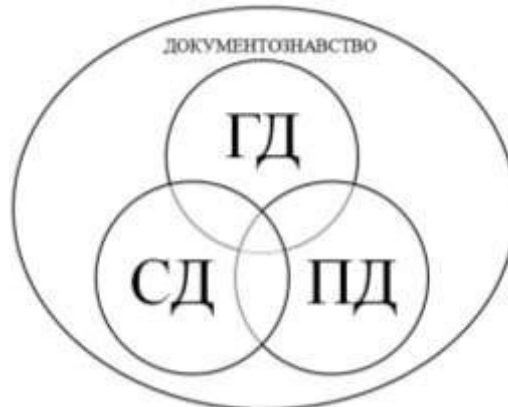
Рис. 4. Діаграма Венна. Місце галузевого документознавства в системі наук про документ