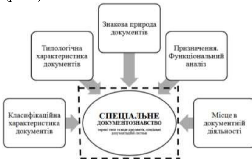
Рис. 2. Діаграма прецедентів спеціального документознавства

Натомість, важіль уваги спеціального документознавства припадає на такі аспекти, як класифікаційні та типологічні характеристики документа або документної системи, знакова природа документа, його функціональний аналіз та місце у документній діяльності та комунікаціях (рис.3).