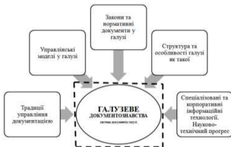
Рис. 2. Діаграма прецедентів утворення системи документів у галузі та галузевого документознавства

управлінське розуміння поняття «документ» (детально розглянуто нами в окремій публікації [9]), усталені схеми документної діяльності тощо, - впливають на специфіку документування управлінських сторін галузі (наприклад, [7; 8]). Інформаційні технології зумовлюють інноваційну складову у ділових процесах галузі: вживання електронних документів, корпоративних та спеціалізованих електронних систем, платформ електронних комунікацій, віддаленого бронювання, звітності тощо.