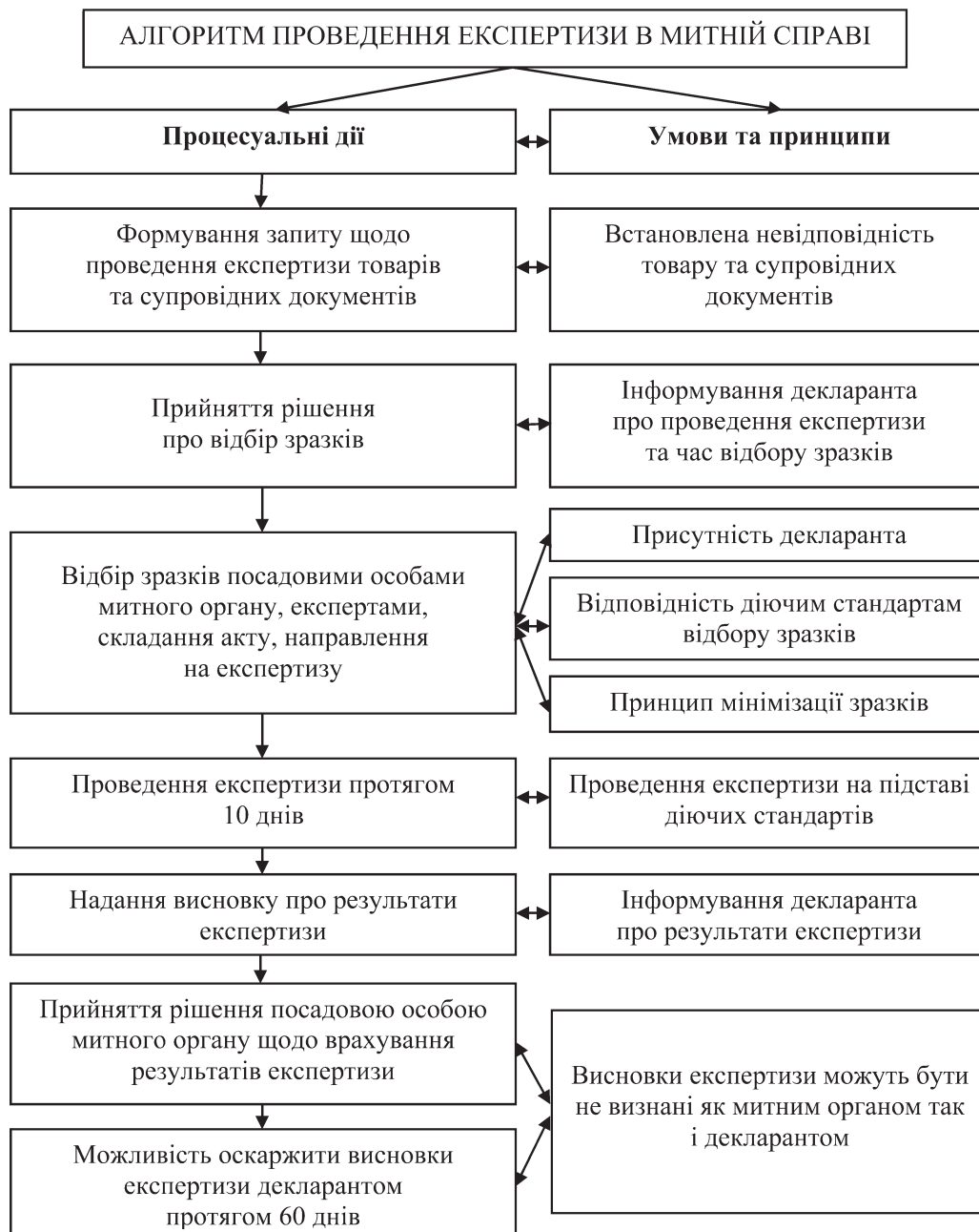
Рисунок 3 — Алгоритм проведення експертизи в митній справі (складено автором за інформацією [5])

На основі аналізу змісту норм джерел митного права сформовано алгоритм проведення митної експертизи, див. рис. 3.