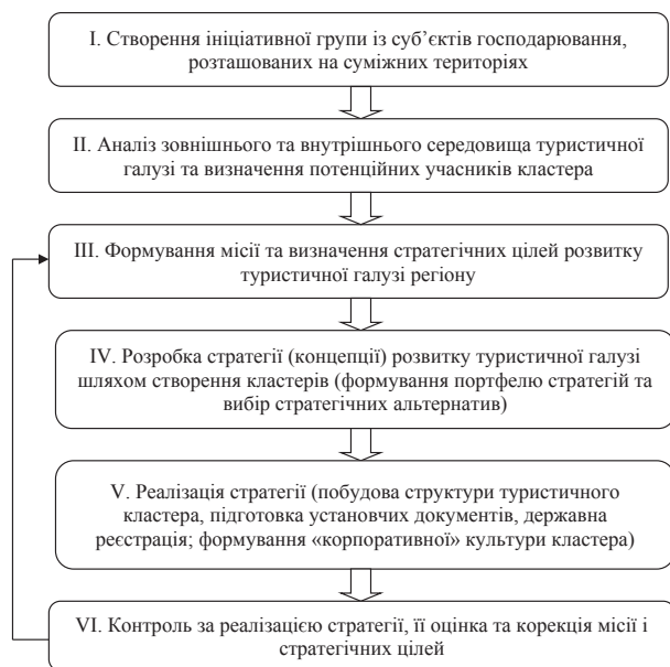
Рис. 1. Схема стратегічного управління регіональним розвитком туризму в рамках кластерного підходу

У рамках створення і розвитку туристичних кластерів стратегічне управління може бути організовано за такою схемою (рис. 1):