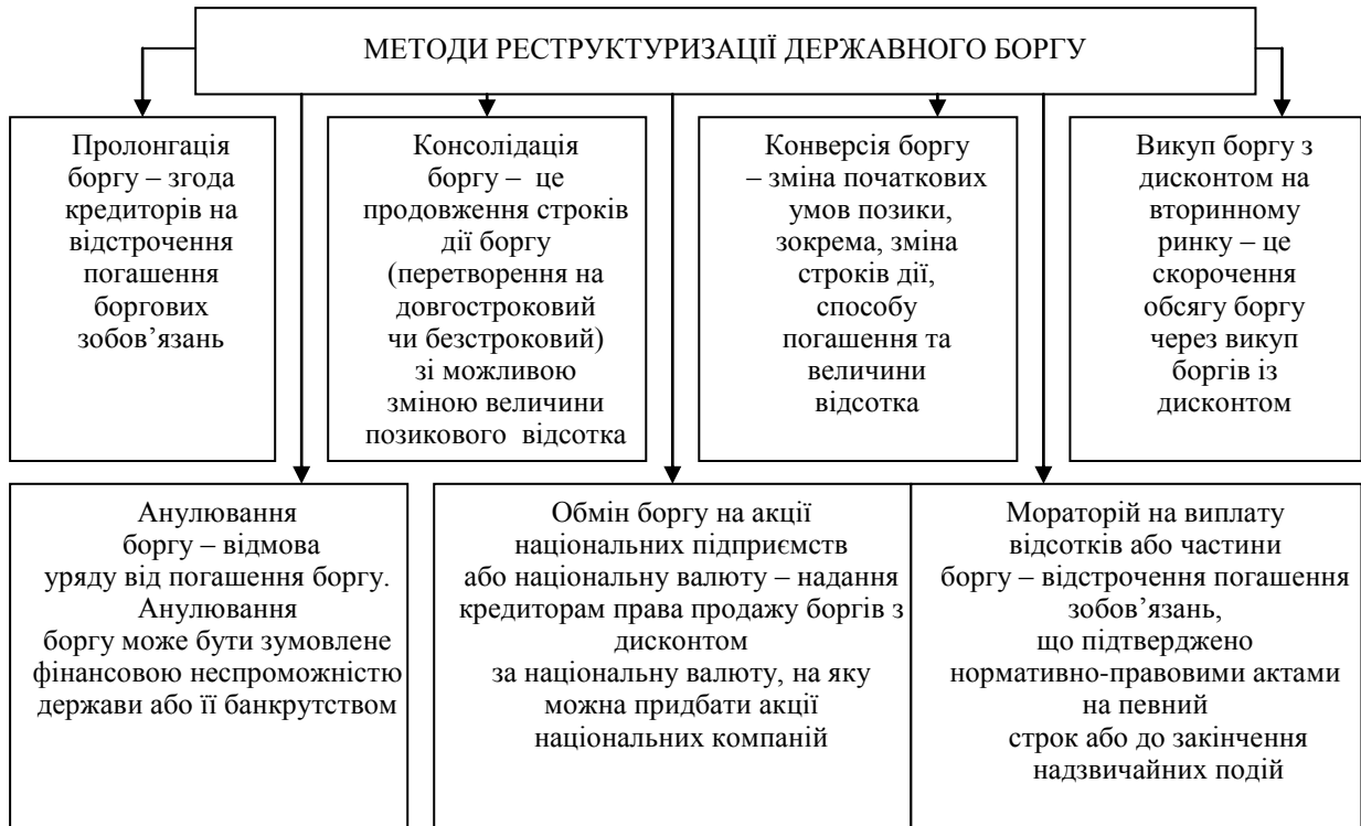
Рис. 2. Методи зниження боргового навантаження на державний бюджет

Якщо обсяги бюджетних доходів є недостатніми, то державні, особливо зовнішні, запозичення викликають дефіцит платіжного балансу та нарощування обсягів державної заборгованості, яка у свою чергу потребує нових запозичень. Намагання уряду сплатити зовнішні зобов'язання за рахунок рестриктивної фіскальної політики можуть привести до вилучення значного обсягу фінансових ресурсів з економічного обороту, результат від проведення якої піде на користь іноземним кредиторам.