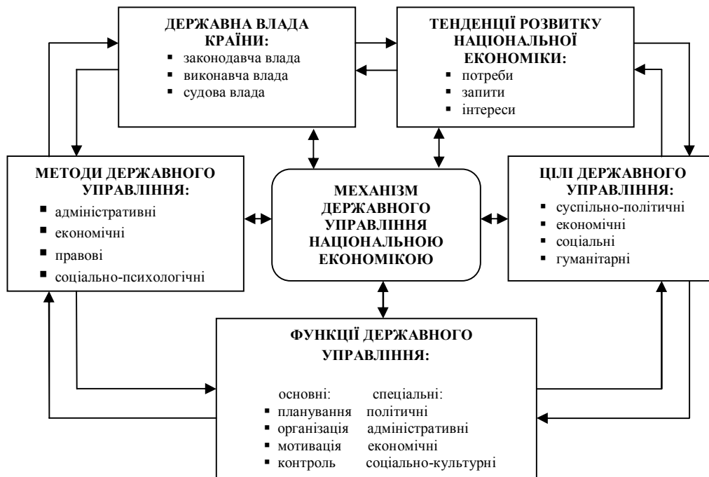
Рис. 1. Взаємодія складових механізму державного управління економікою національного господарства України

структур) і правові (визначають зміст державного регулювання та відповідальність суб'єктів за їх невиконання).