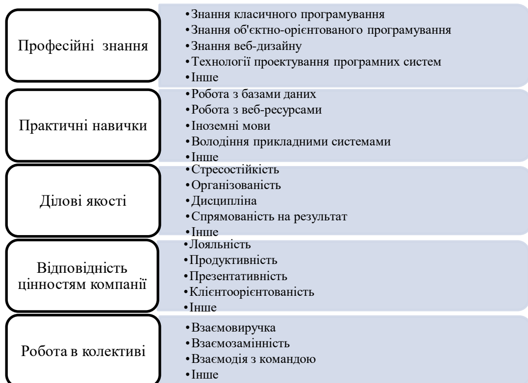
Рис. 1. Вимоги до випускників ІТ-спеціальностей

Крім переліку компетенцій навчальним закладам важливо знати який рівень відповідних компетенцій потрібно ІТ-компаніям. Вищий навчальний заклад, який здатний раціонально використовувати ті години, які йдуть на лабораторні та практичні заняття на ІТ-спеціальності, буде найбільш привабливим для студентів. Звичайно ж матеріальна база має не менше значення, але основним все ж залишаються отримані компетенції і якість викладання. Якщо зупинитися на виявленні вимог до ІТ-спеціальностей, то головними векторами є професійні та практичні навички володіння своєю спеціальністю. До цих напрямків можна додати ділові якості, вміння роботи в трудовому колективі, а також відповідність цінностям компанії. Макет вимог до спеціалістів наведений на рисунку 1.