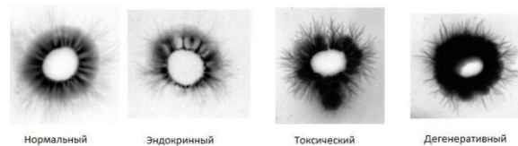
Рисунок 3 – Пример классификации свечений

Для тестирования системы использовалось 30 изображений (рис. 1), в результате обработки которых, точность классификации составляет 90%.