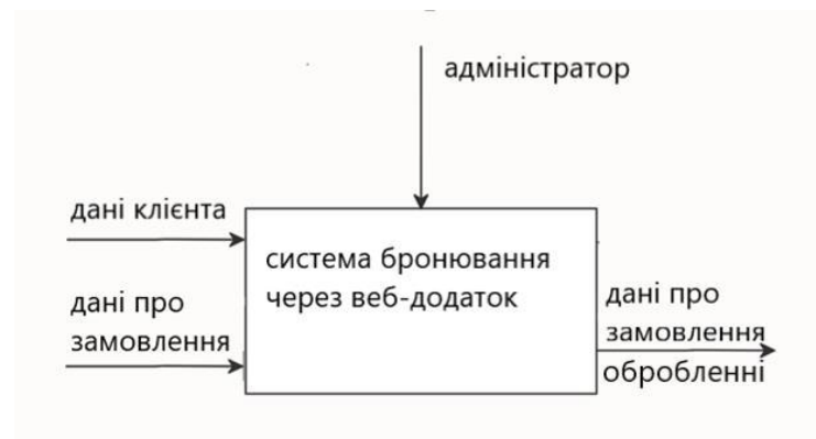
Рис. 1 – Інформаційні потоки системи

При аналізі системи було допрацьовано інформаційні потоки (рис. 1), що були реалізовані на основі технології PHP. Також були використані такі технології як: JavaScript, HTML5, Yii2, Bootstrap [2,3]. Для збереження даних було використано бібліотеку MySQL. Всі технології є безкоштовними та розповсюджуються за відкритими, вільними ліцензіями, а тому їх використання не накладає ніяких обмежень [5,6]]