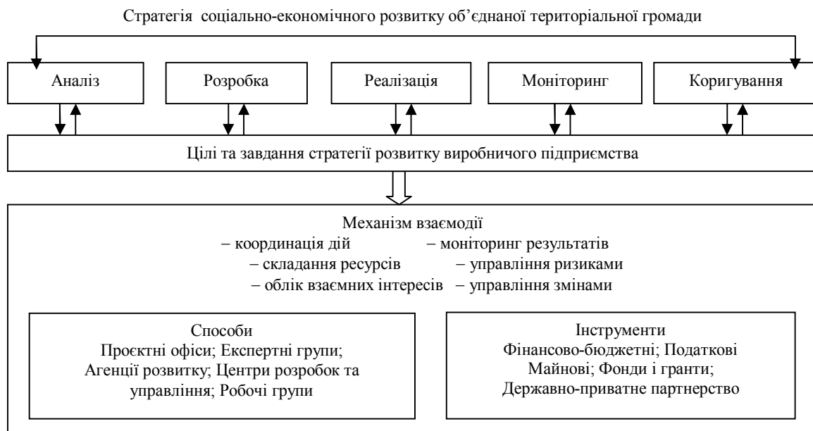
Рисунок 2. Організаційно-логічна схема взаємодії суб'єктів стратегічного управління розвитком виробничого підприємства та об'єднаної територіальної громади

Організаційно-логічна схема визначає порядок і логіку взаємоузгодження стратегічних установок програмних документів різного рівня. В рамках даної схеми визначаються форми, способи і інструменти, що забезпечують узгодження субрегіональних і корпоративних інтересів, а також реалізацію галузевого і територіального підходів до стратегічного планування і управління.