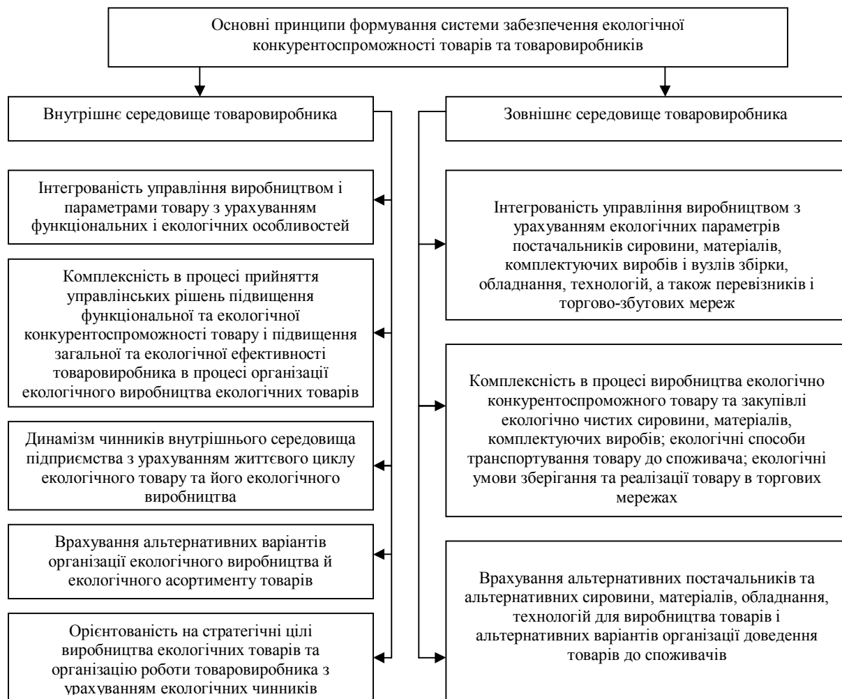
Рис. 3. Основні принципи організації забезпечення управління екологічною конкурентоспроможністю з урахуванням зовнішніх і внутрішніх чинників