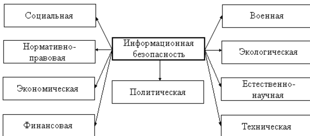
Рис. 1. Аспекты проблемы информационной безопасности

Процесс внедрения новых информационных технологий во все сферы жизни общества немислим без решения вопросов информационной безопасности, которая структурируется в совершенно разных, но связанных между собой аспектах [1, 2] (рис. 1).