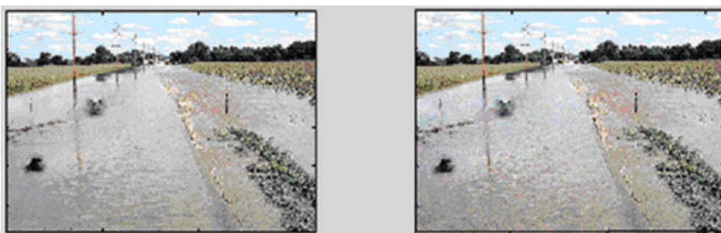
Рис. 1. Изображение I группы качественной оценки: оригинальное изображение (а); измененное изображение (б)