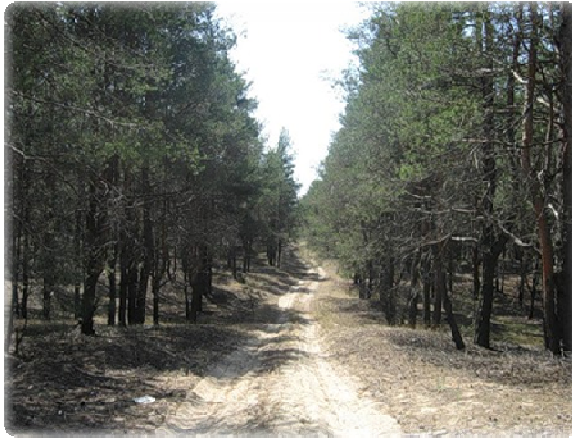
Рис. 2. Цюрупинський ліс

На схід від міста знаходяться Олешківські піски — друга за розмірами пустеля Європи, навколо яких зеленіє 45 тис. га соснового лісу, багатого на дичину та гриби.