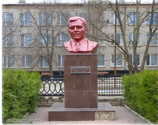
Рис. 9. Пам'ятник Миколі Кулішу

Пам'ятник Миколі Кулішу. Встановлений на честь видатного українського письменника й драматурга М. Г. Куліша, життя та діяльність якого пов'язані з Олешками. Скульптор — Шапко Іван Григорович.