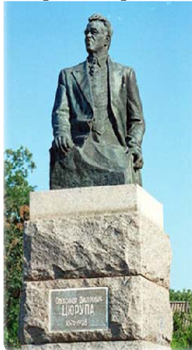
Рис. 4. Пам'ятник Цюрупи Олександра Дмитровича в місті Цюрупинську

Місто розташоване поблизу Олешківських пісків, що дало можливість побудувати тут завод сухих будівельних сумішей. Олешківський пісок є ідеальною складовою для таких сумішей, адже в процентному співвідношенні містить багато кварцу. З жовтня 2007 року — завод по виробництву будівельних сумішей в Цюрупинську, Херсонській області, потужністю 150 тис. тонн у рік. У вересні 2008 р. відбувся запуск нової лінії заводу. Виробнича потужність — 80 тис. тонн асортиментної продукції в рік. Тепер сумарна потужність заводу складає 230 тис. тонн у рік.