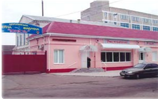
Рис. 7. Цюрупинська Швейна фабрика "ЮНІСТЬ"

Тільки одна швейна фабрика вже випускає свою продукцію, успішно її продає не тільки в Україні, але й експортує її в більш ніж 10 країн Європи. Вона затребувана, тому що надійна і приваблива за показником "Ціна - якість".