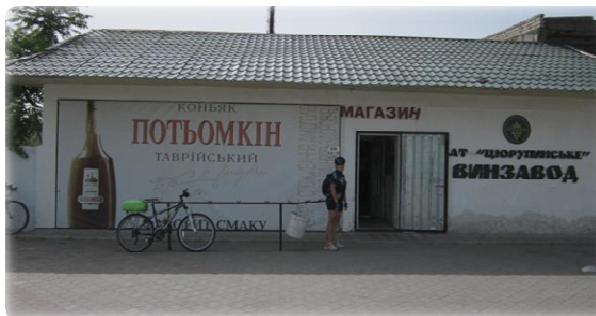
Рис. 6. Виноробний завод «Вина Олешія» ВАТ «Цюрупинське».

Також в Цюрупинську є виноробний завод, в якому виготовляють дивовижні за своїми смаковими якості вина торгової марки «Вина Олешія» ВАТ «Цюрупинське».