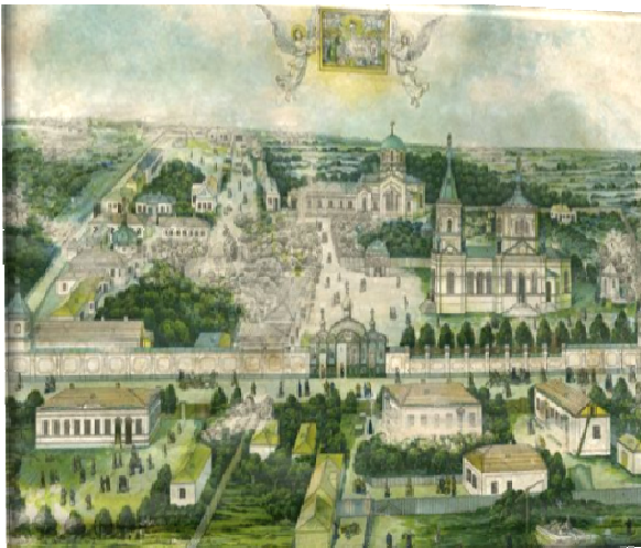
Рис. 10 Зображення Успенського монастиря

Успенський монастир. Заснований у 1896 році. На початку ХХ століття складався з Успенського собору, трапезної, дзвіниці, каплиці, келій, господарських будівель, огорожі з вежами, — усе в російсько-візантійському стилі. У роки радянської влади більшість будівель комплексу було зруйновано. До наших днів зберігся тільки один будинок початку ХХ століття, декорований у псевдоруському стилі. Проте з початку ХІХ ст. почалась відбудова монастиря.