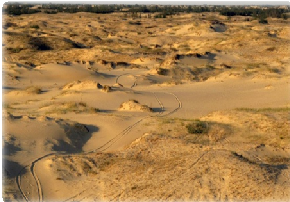
Рис.3. Цюрупинська пустеля

Екологічно чисте та безпечне навколишнє середовище забезпечує хвойний ліс, який очищає та збагачує киснем повітря, а наявність річок, озер та плавнів створює хороший мікроклімат.