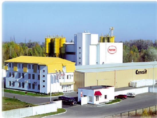
Рис. 5. Завод по виробництву будівельних сумішей

В Цюрупинську працює паперовий комбінат — єдине місце в Україні, де виробляють папір для фільтрів машин.