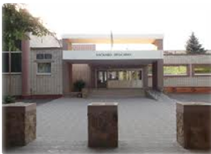
Рис. 12. Цюрупинська спеціалізована ЗОШ I–III ступенів № 2