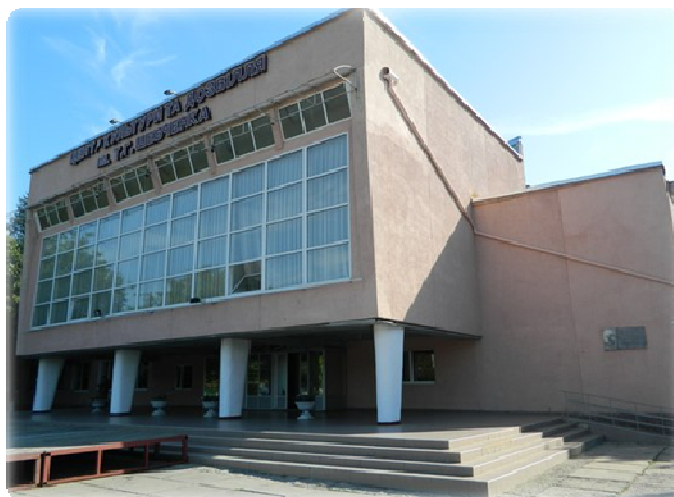
Рис.11. Цюрупинський Будинок культури і дозвілля ім. Т. Г. Шевченка

Соціальна інфраструктура міста поєднує у собі діючі 3 загальноосвітні школи (Цюрупинська гімназія, ЗОШ I–III ступенів № 2, ЗОШ I–III ступенів № 4), 3 будинки-інтернати, 4 дитячих садочки, Центр культури та дозвілля, п'ять бібліотек, дитяча школа мистецтв, центр дитячої творчості, спортивна школа, 3 спортивні клуби, стадіон та станція юних техніки та Будинок культури і дозвілля ім. Т. Г. Шевченка.