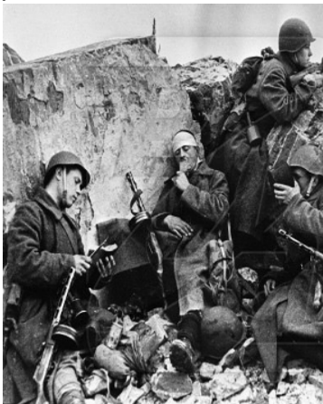
Рис. 2. Радянські солдати на передовій

Повітря, гаряче від спеки, змішалось з піднятою вгору порохнявою, димом, що стелився від згорілих танків, тліючої трави, різкими запахами вибухівки. Від всього того не було чим дихати, сльозилися очі. В захисників вогненного рубежу, котрих залишалось все менше і менше, сили вже були на межі. Та все ж вони