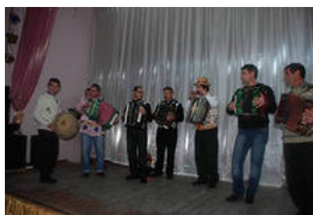
Рис.13 . Обласний фестиваль-конкурс «Грай, гармонь!»

Родзинкою фестивального руху Херсонщини є один з найвідоміших театральних фестивалів на Україні - міжнародний театральний фестиваль «Мельпомена Таврії».