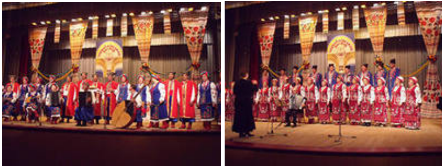
Рис.2 . Регіональний фестиваль хорового виконавства «Чорнобаївський заспів».

Даний форум є яскравим, незабутнім дійством. Його гімн, написаний Д. Моторним, оспівує благородну хліборобську справу і цілковито передає настрій людей, що поєднали в співочій душі любов до рідної землі та прагнення вічної краси. Виконавці демонструють високу культуру акапельного співу, вокальну майстерність, оригінальні обробки українських народних пісень. Виконавський рівень учасників фестивалю викликає у глядачів справжнє захоплення. Адже пісня – душа народу, в ній сплелися історія, мрії та прагнення багатьох поколінь. Любов до народного співу невідривна від любові до рідної землі. Тому, плекаючи шану до української пісні, організатори фестивалю рік у рік будують вічний храм справжнього мистецтва.