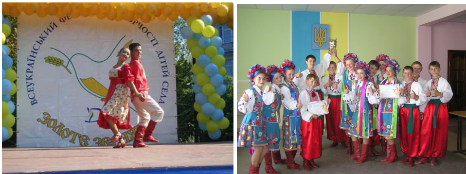
Рис.1. Всеукраїнський фестиваль дитячої сільської творчості «Золоте зернятко»

Головною метою фестивалю є пошук талановитої сільської молоді, а девізом - організатори обрали гасло «Ми всі - єдина родина». Символом фестивалю є синиця, що несе пшеничний колосок.