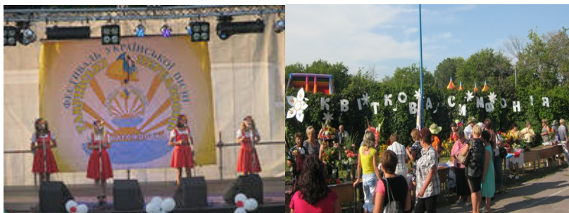
Рис.3 . Фестиваль «Таврійські передзвони»

Мета заходу – пропаганда української, народної та естрадної пісні, виявлення нових талановитих виконавців, вдосконалення вокальних здібностей молодих конкурсантів, виховання почуття патріотизму.