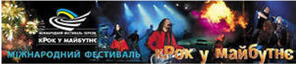
Рис.7 Міжнародний фестиваль «кРок у майбутнє»

усіх народів й народностей, що проживають, як на території України, так і за її межами.