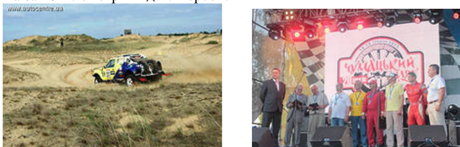
Рис.15. Ралі «Чумацький Шлях»

Традиційними місцями для ралі «Чумацький шлях» є мікрорайон «Таврійський», а також СУ «Кар'єр», який розташований біля села Тягинка за 40 кілометрів від м. Херсон.