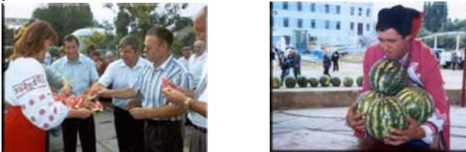
Рис.12 . Кавуновий фестиваль «Солодке диво»

Крім концертної програми фестиваль включає також і дегустацію кавунів та день, вирощених на землях мальовничої Херсонської області. Цікавою родзинкою фестивалю є аукціон найбільших та найтяжчих кавунів.