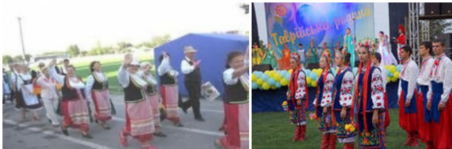
Рис.11 . Всеукраїнський фестиваль національних культур «Таврійська родина»

На фестиваль запрошуються художні колективи національних культурних спільнот, виконавці народних танців, майстри декоративно-прикладного мистецтва. Всі учасники нагороджуються дипломами та пам'ятними сувенірами з емблемою фестивалю «Таврійська родина».