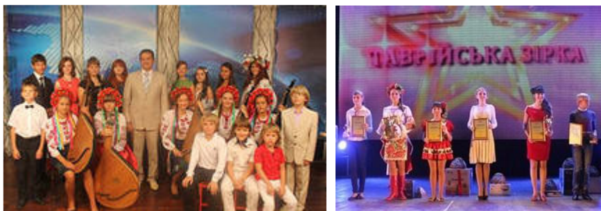
Рис.4 . Фестиваль «Таврійська зірка»

Протягом року більше тисячі талановитих дітей Херсонщини віком від 5 до 18 років брали участь у відбіркових турах фестивалю. Вони знімали кліпи у студії телеканалу та брали участь у майстер-класах із професійними музикантами і педагогами, змагались в таких номінаціях, як вокал, хореографія, театральне та музичне мистецтво.