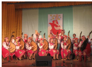
Рис.10 . Регіональний фестиваль народної музики «Чумацький шлях»

Фестиваль збирає найкращі капели бандуристів, оркестри, ансамблі народних інструментів.