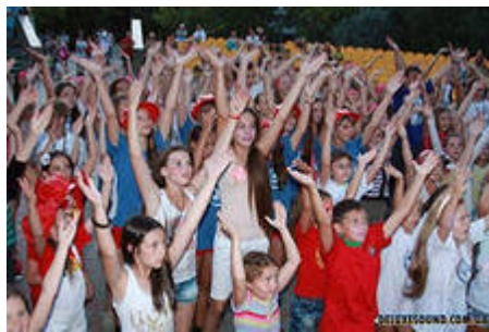
Рис.6 . Міжнародний благодійний дитячий фестиваль «Чорноморські ігри»

Основні завдання фестивалю - культурне та естетичне виховання дітей і підлітків; надання можливості для виявлення та сприяння юним талантам; визначення найкращих дитячих колективів, солістів, музичних творів, танцювальних колективів; пропаганда активних форм дозвілля, відволікання дітей і підлітків від правопорушень, наркоманії шляхом організації і проведення в Україні на високому культурному і естетичному рівні якісного, видовищного фестивалю.