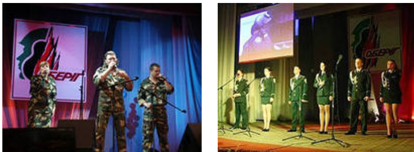
Рис.8. Всеукраїнський фестиваль патріотичної військової пісні «Оберіг»

Всеукраїнський конкурс-фестиваль військово-патріотичної творчості «Оберіг» відбувається за ініціативою Херсонської обласної організації Української Спілки ветеранів Афганістану та підтримки обласної державної адміністрації щорічно у м. Херсоні на базі обласного Палацу молоді і студентів.