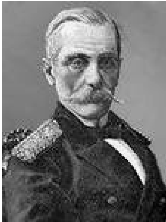
Рис. 8 О.С. Ерделі

У 1874-1890 роках на посаді губернатора знаходився дійсний статський радник Олександр Семенович Ерделі, який доклав чимало зусиль для розвитку краю та Херсона.