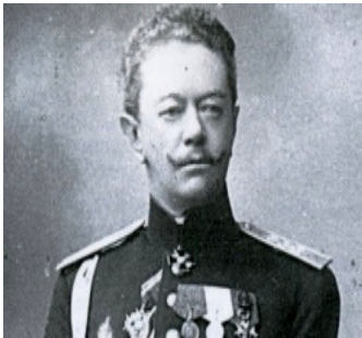
Рис. 4 А.Ф.Комстадіус

Губернатор Херсонщини у 1821 – 1828 роках - Август Федорович Комстадіус