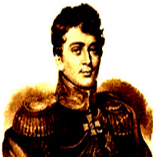
Рис. 3 Граф Карл Францевич Сен-Прі

Губернатор Херсонщини у 1816-1821 рр., нащадок стародавнього французького роду - Граф Карл Францевич Сен-Прі.