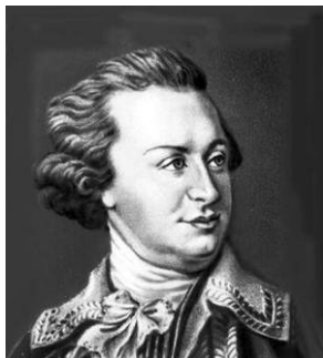
Рис. 1. Г.О. Потьомкін

Не рахуючи людські життя і кошти, вів успішні агресивні війни з Туреччиною, будував нові міста, фортеці і Чорноморський флот, залюднював і колонізував Південну Україну. Так, внаслідок його наказу 1776 р. "втікачів не повертати", на Херсонщині посунули втікачі з усієї України, а Херсон, який він дуже любив і хотів зробити своєю резиденцією і центром південної України, швидко зростав і прикрасився багатьма чудовими спорудами.