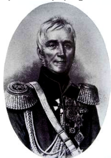
Рис. 2 Воронцов М.С. [1782-1856]

За своїми поглядами М.С. Воронцов був близьким до раннього руху декабристів, прихильником поступового визволення селянства. Великий землевласник, він запроваджував у своїх маєтках нові форми господарювання. Відповідно до своїх ліберальних переконань намагався створити на Півдні України сприятливі умови для розвитку капіталістичних відносин, підприємницької діяльності, піднесення аграрного виробництва. Багато зробив М.С. Воронцов для розвитку культури й освіти Півдня України. У 1825 році створено просвітницький музей при Одеському товаристві історії та старожитностей. У 1829 році розпочалися сезони Одеського філармонійного товариства, а у 1830 – відкрита міська публічна бібліотека. У 1834 році в Одесі надруковано першу книгу українською мовою "Маруся. Повесть віршована".