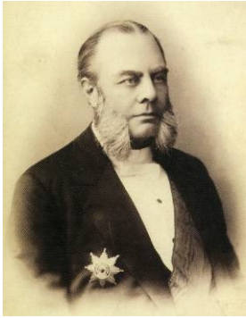
Рис. 5 М.М. Веселкін

Губернатор Херсонщини у 1893-1897 - Веселкін Михайло Михайлович