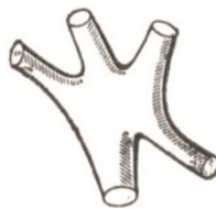
Рис. 2 – Образ коммутационной структуры

Учитывая современную прогрессивную тенденцию построения и развития систем ДАБ является открытой и может легко адаптироваться под новые разрабатываемые и используемые САПР.